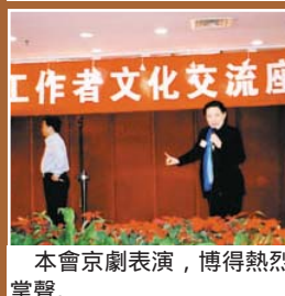
本會京劇表演，博得熱烈掌聲。