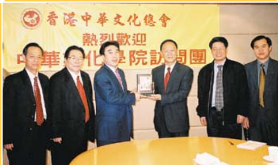
香港中華文化總會向中華文化學院致送紀念品。