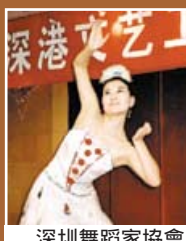
深圳舞蹈家協會的獨舞表演，舞技精湛。