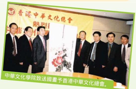
中華文化學院致送國畫予香港中華文化總會。

中華文化學院成立於1997年1月，全國人大常委會副委員長何魯麗任院長。學院的辦院宗旨是加強與港澳台同胞以及海外華僑華人的文化交流，發展和弘揚中華文化，以中華文化為紐帶，增進海內外全體中國人的文化認同，實現中華民族的大團結、大聯合，促進祖國和平統一，實現中華民族的偉大復興。因此，學院在培訓和交流工作方面下了很大的功夫，培訓和接待了不少港澳台和外國青年交流團。