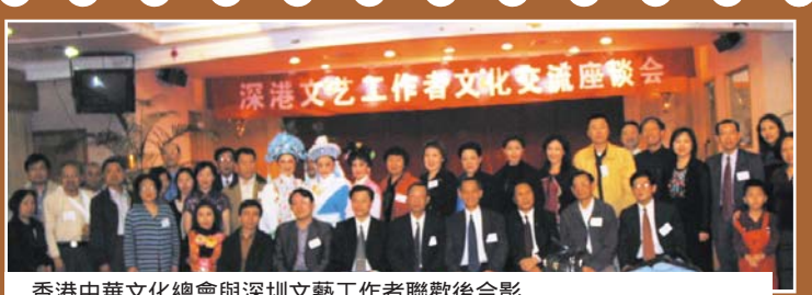
香港中華文化總會與深圳文藝工作者聯歡後合影。