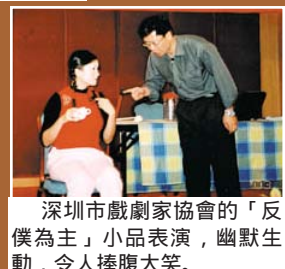
深圳市戲劇家協會的「反僕為主」小品表演，幽默生動，令人捧腹大笑。