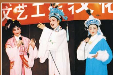
本會越劇表演，亮麗的服裝十分悅目。